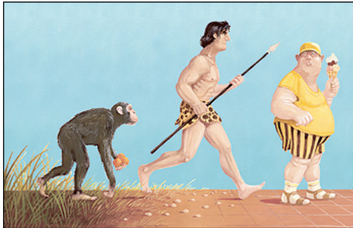
Illustration: Gerhard Glück für DIE ZEIT

Internet: Jeden Morgen mailten ein Freund und er einander den aktuellen Pegelstand der Waage zu. Schummeln verboten.